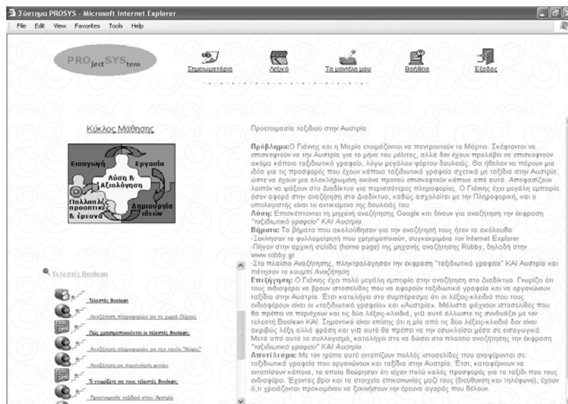
Σχήμα 1: Κεντρική οθόνη ProSys - φάση “Πολλαπλές Προοπτικές και Έρευνα”: αριστερά εμφανίζεται ο κύκλος μάθησης και σύνδεσμοι προς το εκπαιδευτικό υλικό ενώ δεξιά η περίπτωση “Προετοιμασία ταξιδιού στην Αυστρία” (τελεστής Boolean “ΚΑΙ”).

Το εκπαιδευτικό υλικό που παρέχεται στη φάση “Πολλαπλές Προοπτικές & Έρευνα” είναι οργανωμένο γύρω από τις σημαντικές έννοιες του πεδίου εφαρμογής με βάση τους μαθησιακούς στόχους που έχουν τεθεί (για παράδειγμα στην περίπτωση που το πεδίο εφαρμογής αφορά στις Μηχανές Αναζήτησης, το εκπαιδευτικό υλικό αφορά στις έννοιες “Λέξεις-κλειδιά”, “Αναζήτηση με χρήση φράσεων”, “Τελεστές Boolean”, κ.λπ). Επιπλέον οι περιπτώσεις που περιλαμβάνει το εκπαιδευτικό υλικό της κάθε έννοιας έχουν συγκεκριμένη μορφή και αποτελούνται από πέντε τμήματα (Kolodner & Guzdiak 2000) (βλέπε Σχήμα 1 – περίπτωση “Προετοιμασία ταξιδιού στην Αυστρία”): α) μια περιγραφή του προβλήματος, β) τη λύση που προέκυψε από κάποιον ειδικό (συνήθως) στο θέμα, γ) τα βήματα που ακολούθησε ο ειδικός κατά την επίλυση του προβλήματος, δ) μια επεξήγηση/αιτιολόγηση της εξέλιξης της συγκεκριμένης περίπτωσης, και ε) το αποτέλεσμα της λύσης που εφαρμόστηκε.